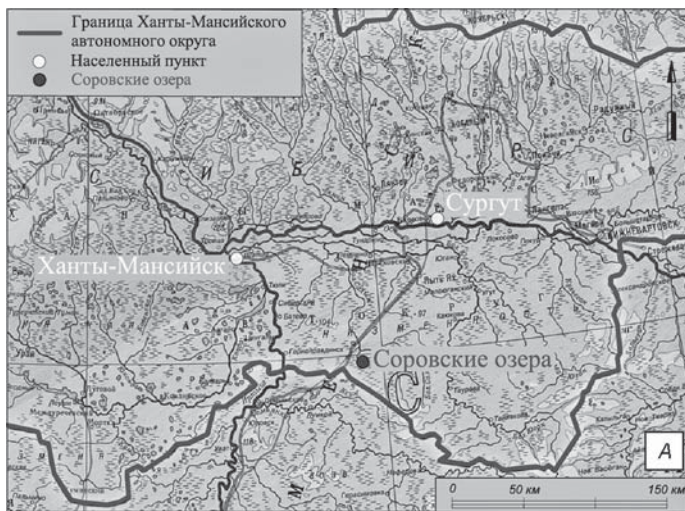
Рис. 1. Соровские озера (Ханты-Мансийский автономный округ – Югра).

В задачи работы входило определение хронологии выбранных памятников радиоуглеродным мето-