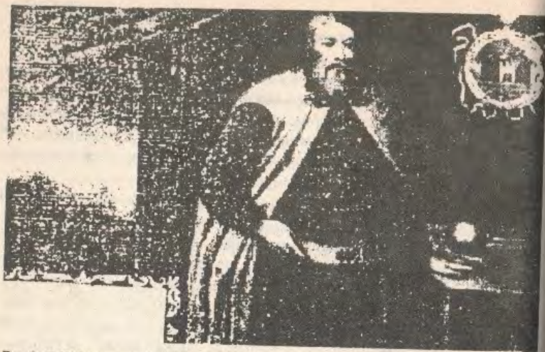
Рис.3. Г.Н.Одольский. Портрет И.В.Власова, иркутского и нерчинского воеводы. 1694/95 г.

статей особых затруднений. Традиционное содержание наказов, почти одинаковое для всех городов, было добросовестно перенесено в наказные статьи, предназначенные для отдельных городов 53 . Из документов подобного рода, составленных после 1695 г., наиболее оригинальны наказные статьи нерчинским воеводам 54 , что, впрочем, вполне понятно. Значительное место в них уделяется отношениям с Цинским Китаем (соблюдение условий Нерчинского договора 1689 г., порядок пропуска в Китай торговых людей, прием послов и т.п.). Таким образом, что бы ни имел в виду указ 1695 г., он только закрепил сложившееся ранее содержание наказов.